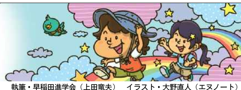
執筆・早稲田進学会(上田竜夫) イラスト・大野直人(エヌノート)